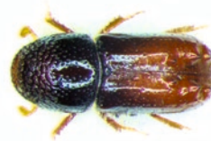
Dospělec lýkožrouta lesklého

se vyvíjí pod kůrou větví starých smrků, ve vrcholové části koruny nebo na mladých stromcích; na kmeni dospělých smrků ve střední a spodní části se vyskytuje méně často. Vývoj trvá 6 – 10 týdnů.